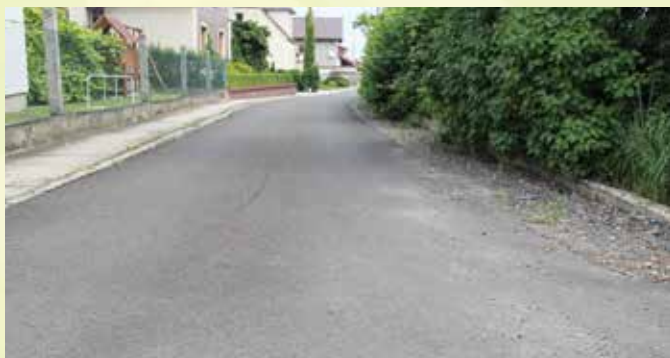
Mechnice, ul. Krótka