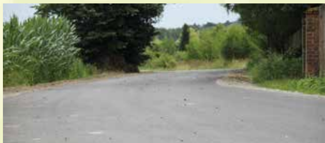
Siedliska, ul. Leśna