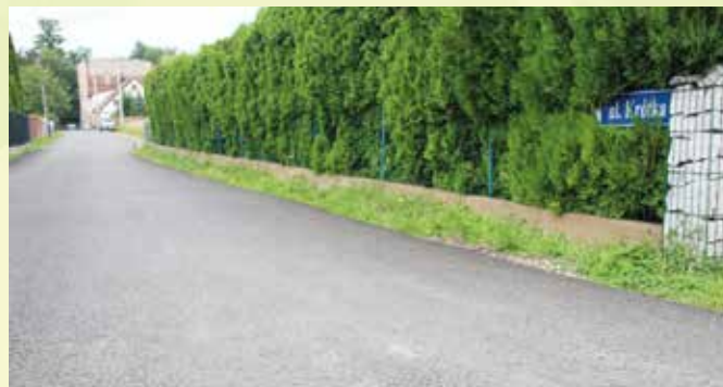
Niewodniki, ul. Krótka

Aktualnie do remontu zlecono: ul. Nadodrzańską w Żelaznej, drogę do przysiółka Zorgi, ul. Brzozową w Naroku oraz drogę do Cmentarza w Skarbiszowie. Na przełomie roku planowana jest również przebudowa ul. Miodowej w Karczowie. Przewidywana kwota dotacji na poprawę infrastruktury drogowej o jaką wystąpi samorząd to niemal 5 mln złotych. 200 tys. złotych na tegoroczne remonty będzie pochodziło z budżetu gminy.