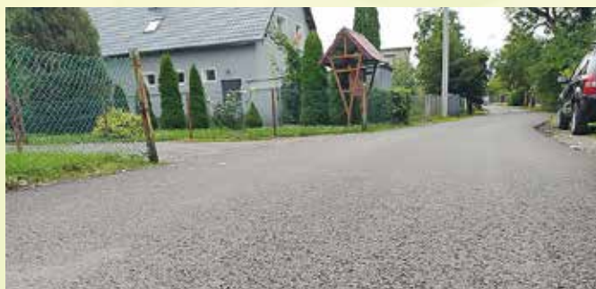
Niewodniki, ul. Młyńska