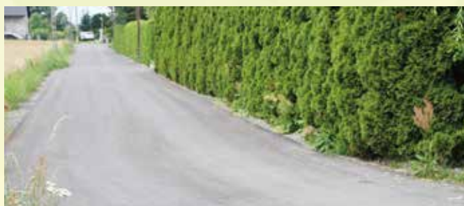
Chróście, ul. Nowowiejska