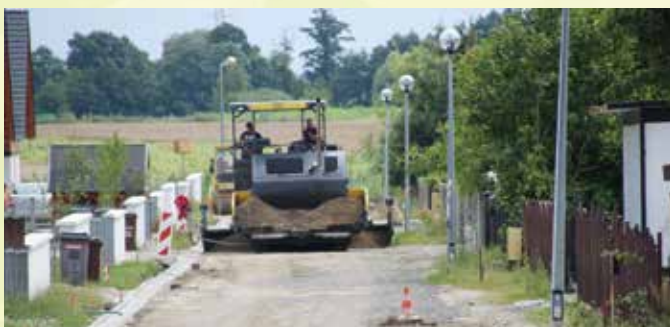
Mechnice, ul. Kwiatowa